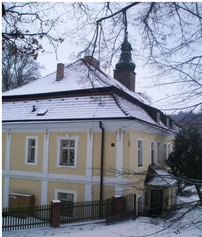
Původní budova Domova Jeřabina v Těchobuzi

Transformací projde celé zařízení, jedná se o transformaci úplnou. Domov Jeřabina zcela opustí současné prostory zámku a přilehlých budov. Plánovaná kapacita domova po transformaci je 72 lůžek.