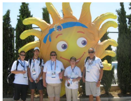
Autor: Ing. Slavomil Štefán, ředitel DSS Skřivany