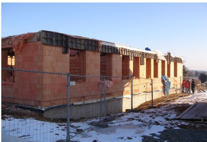
Foto: Kraj Vysočina – Transformace Ústavu sociální péče Jinošov. Lokalita Velká Bíteš – Domov pro osoby se zdravotním postižením - domácnost pro osoby s vysokou mírou podpory

Výzva byla zaměřena na investiční podporu transformace pobytových zařízení sociálních služeb. V rámci výzvy č. 2, která byla otevřena 13. 7. 2009, bylo podáno celkem 7 projektů v celkové hodnotě 413 228 670,- Kč. Mezi kraje, které podaly projekty do výzvy č. 2, patří kraj Pardubický, Plzeňský, Moravskoslezský, Ústecký a Kraj Vysočina.